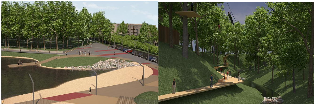
Projektas „Kompleksinis Prienų miesto viešųjų erdvių esančių tarp Statybininkų, J. Lukšos, Vytenio ir Kęstučio gatvių ir prie Kęstučio g. Nemuno upės pusėje sutvarkymas, pritaikant jas bendruomenės ir verslo poreikiams“